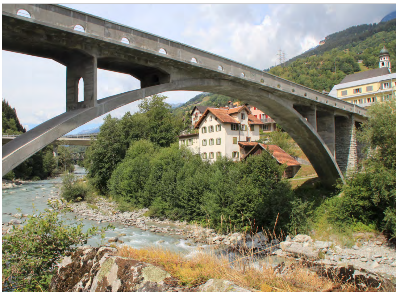
La punt sco ch'ella sa preschenta suenter la renovaziun.